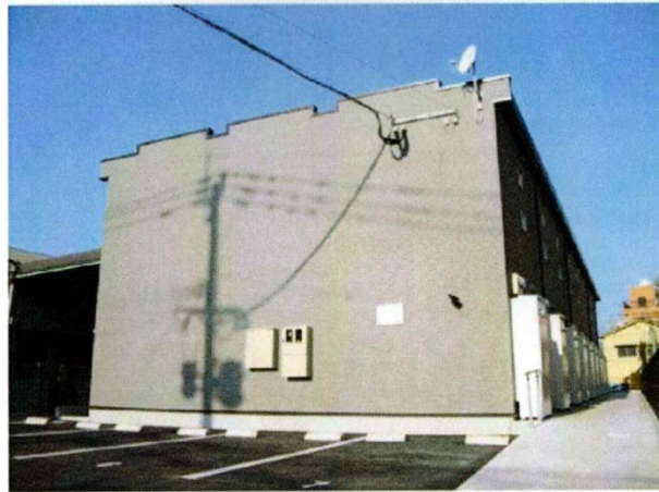
部屋の特徴・設備

月額賃料 708120円/月 年間賃料 8497440円/年(屋根賃料除く) (※大手賃貸会社一括借上げの場合)