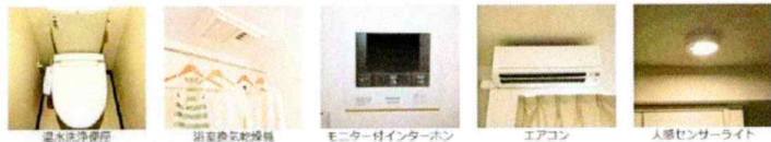
温水洗浄便座 浴室乾燥機 モニター付インターホン エアコン 人感センサーライト